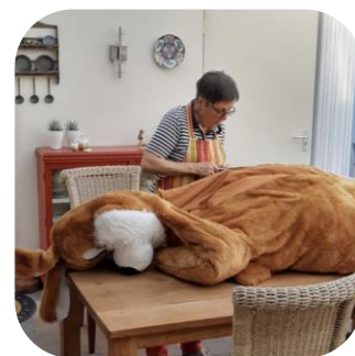
Oppi op de operatietafel vlak voor Pasen. Hij was net op tijd opgeknapt!